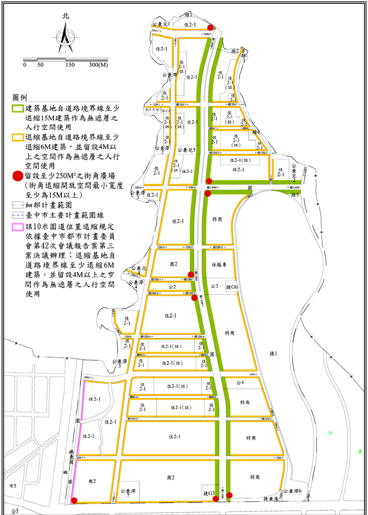
圖 5-4 計畫指定留設公共開放空間示意圖