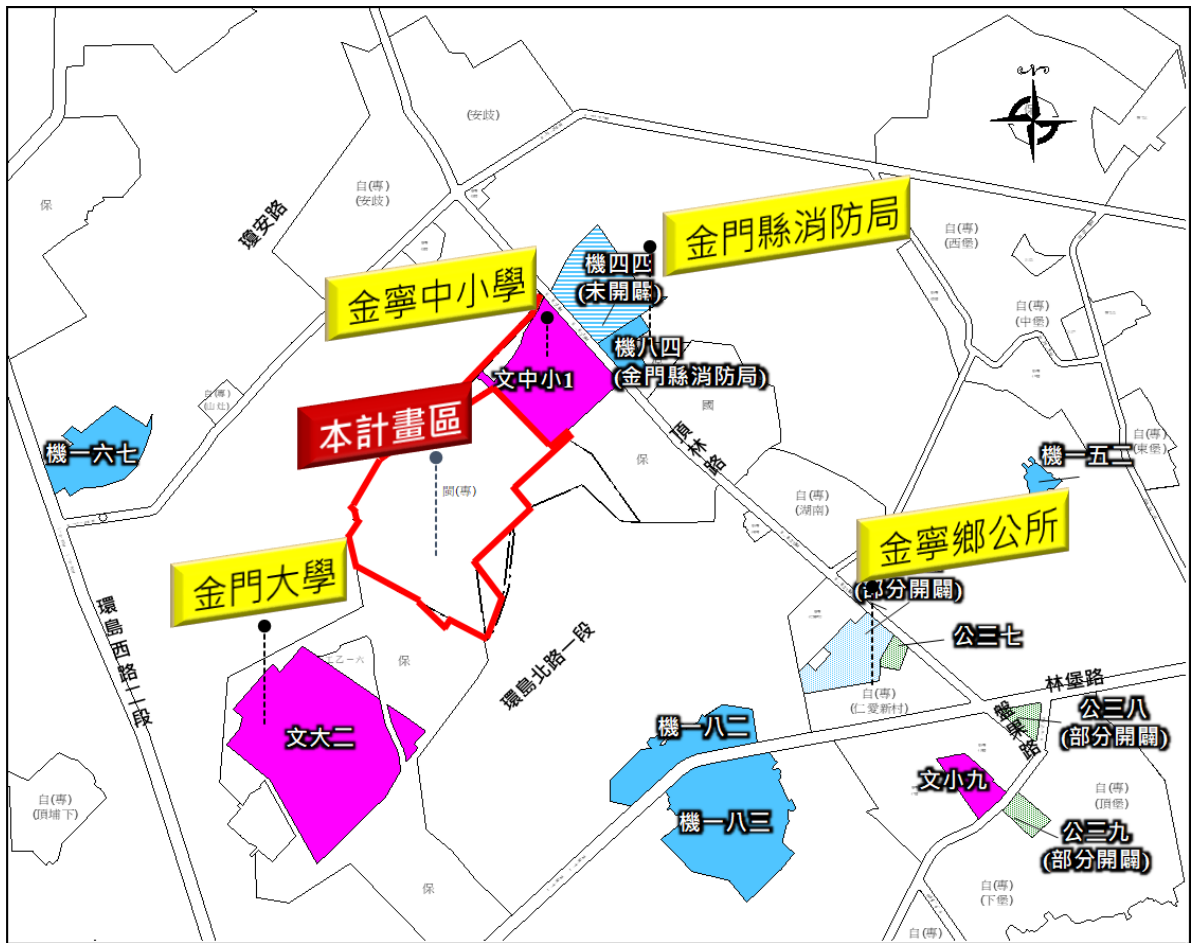
圖 1、區段徵收範圍圖